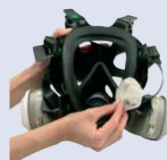
3M™ 105 Toallita limpiadora facial