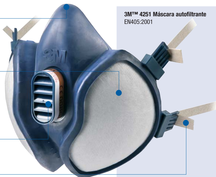
3M™ 4251 Máscara autofiltrante EN405:2001