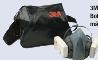
3M™ 106 Bolsa para media máscara