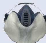
Protector del filtro 3M™ 400 (adecuado para aplicaciones en spray)