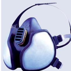
3M™ 4251 Máscara autofiltrante Vapores orgánicos y partículas FFA1P2D