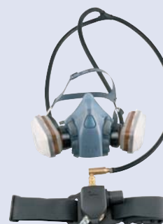
3M™ S-200 Suministro de aire EN139:1994 NPF=50 con media máscara. NPF=200 con máscara completa.