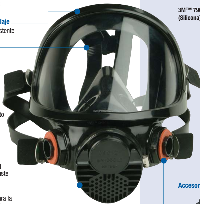
3M™ 7907S Máscara completa reutilizable (Silicona). EN 136 (Clase 2)